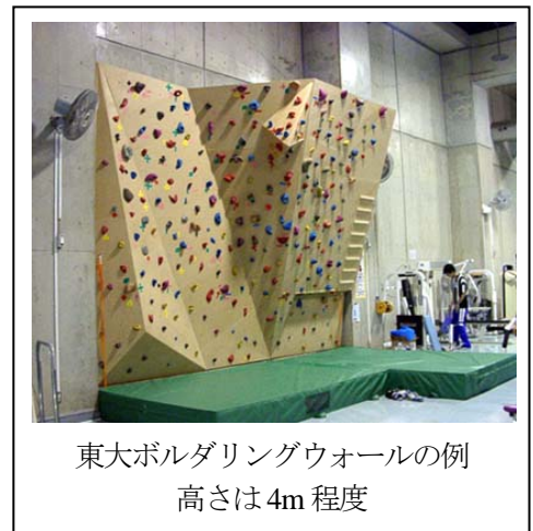
東大ボルダリングウォールの例 高さは4m 程度